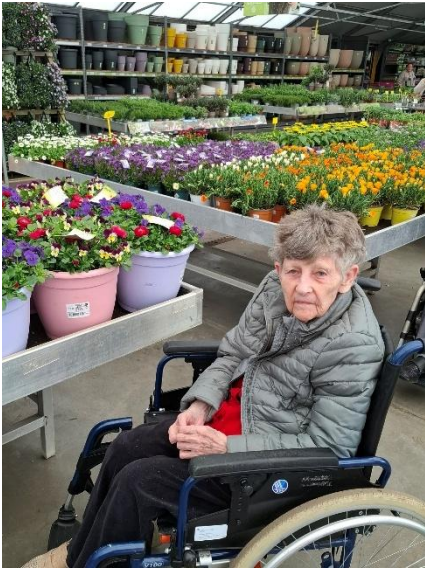
Bezoek Interflower Vlindertuin 20 maart