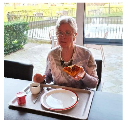
Kookactiviteit - pizza's maken 2 de verdiep 24 maart